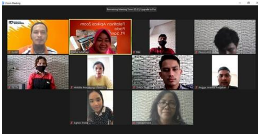
Gambar 2. Pelaksanaan Pelatihan

Adapun luaran yang dicapai dalam pelaksanaan pengabdian kepada masyarakat ini dapat diuraikan sebagai berikut: