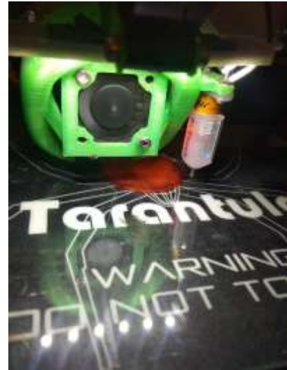
Gambar 5. Proses Mencetak Komponen

Proses pengaturan mesin cetak dilakukan dengan bantuan aplikasi repetier host. Aplikasi ini akan membantu dalam pengaturan posisi, suhu, skala, dan kepadatan produk. Dalam proses ini akan sistem akan merubah pengaturan dan desain 3 dimensi dalam bentuk file g.co. File ini yang mampu di terjemahkan oleh mesin cetak 3 dimensi.