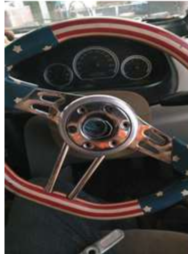
Gambar 1. Komponen Interior Tombol Klakson Rusak

Desain produk yang dihasilkan dalam penelitian ini merupakan hasil pembuatan desain 3 dimensi dari komponen interior mobil. Desain produk ini mengacu pada produk original dari mobil. Oleh karena itu, ukuran, bentuk, dan profil yang akan dibuat sesuai dengan produk originalnya. Tahapan pembuatan produk dapat dilihat pada uraian berikut.