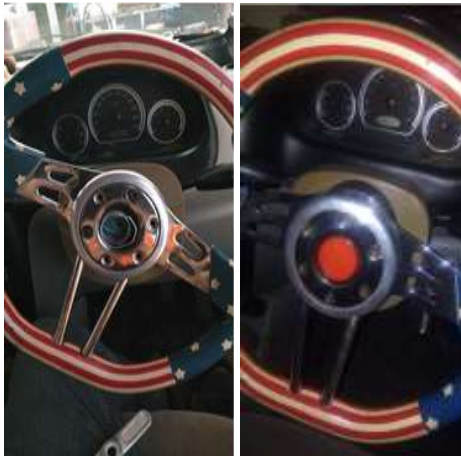
Gambar 7. Perbandingan Tampilan Produk

Hasil desain dengan produk asli pada penelitian ini tidak dapat dibandingkan karena komponen asli sudah rusak dan pecah dalam beberapa kepingan. Sehingga untuk mempermudah perbandingan bisa dibandingkan komponen pada saat belum dibuatkan komponen dengan yang sudah dibuatkan.