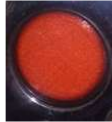
Gambar 8. Teksture Hasil Cetakan

Teksture yang terdapat pada komponen tombol klakson yaitu halus. Lebih jelas bisa dilihat pada gambar 8 berikut.