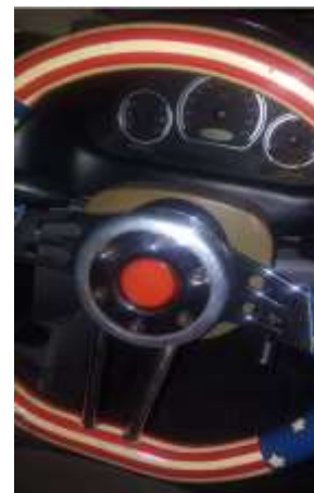
Gambar 6. Pemasangan Komponen Hasil Pembuatan di Mesin 3 Dimensi

Proses pencetakan produk sepenuhnya sudah diatur secara otomatis. Proses pencetakan ini membutuhkan waktu yang bervariasi sesuai dengan ukuran dan tingkat kesulitan dari desain yang dibuat. Apabila ingin melihat estimasi waktu yang dibutuhkan bisa dilihat pada gambar 4, di aplikasi repetier host.