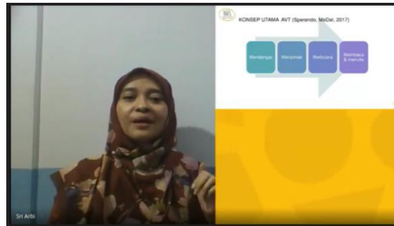
Gambar 1. Materi Konsep Utama AVT