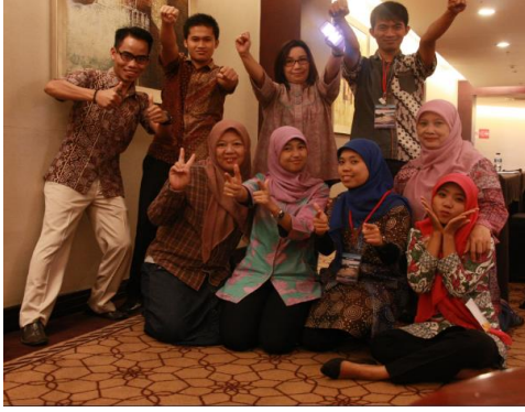
Gambar 4. Foto Bersama Peserta